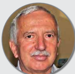
Dézsi Attila polgármester-jelölt