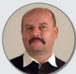
Farkas Lajos polgármester- és képviselőjelölt